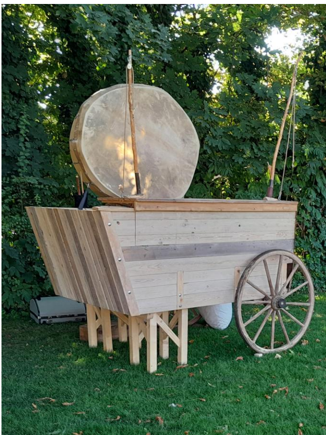
La scène de Rok Prasete convient à l'intérieur et à l'extérieur.

Sur la Cie Waxwing: https://tinyurl.com/44k42uxu