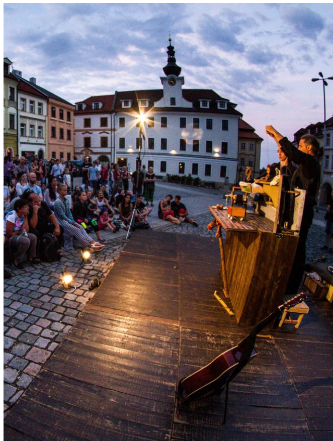
La Cie Waxwing à l'Open Air Festival (Hradec Kralové, CZ).